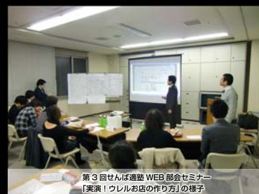
第3回せんば適塾WEB部会セミナー 【講演！ウレルお店の作り方】の様子